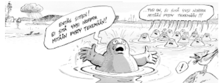
Kuvitus: Seppo Leinonen. Kuvia saa käyttää ainoastaan melojan ympäristöohjelmasta kerrottaessa.

Keväällä 2001 järjestetään muutama alueellinen koulutustilaisuus, ja syksyllä kootaan kokemuksia toiminnasta, ongelmista ja onnistumisista sekä pohditaan kehittämistarpeita ja tulevaisuuden haasteita. Ohjelman lähteinä on käytetty useimpia lisätiedon lähteitä -kohdassa luetelluista oppaista.